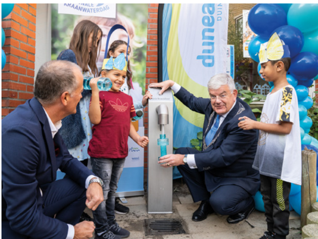
Officiële opening van een tapkraan bij basisschool 't Palet in Den Haag

In opdracht van de Consumentenbond is onderzoek gedaan naar de impact van kraanwater en flessenwater op het milieu. Daaruit is gebleken dat een liter bronwater in een petfles (van 0,5 en 0,75 liter) maar liefst 500 keer meer CO 2 -uitstoot veroorzaakt dan een liter kraanwater. Er valt dus veel CO 2 te besparen als mensen niet langer flesjes water kopen en vervolgens weggooiden, maar recyclebare flesjes bij een watertappunt steeds opnieuw vullen met koel, lekker én gezond drinkwater. Een besparing die per tapkraan zomaar kan oplopen tot 5.000 kilo CO 2 per jaar. Dat staat gelijk aan 1.000 uur douchen. Ook uw gemeente, school of sportvereniging kan daar nu een begin mee maken, samen met Dunea die tapkransen volgens de hoogste kwaliteitsnormen in eigen werkplaats maakt.